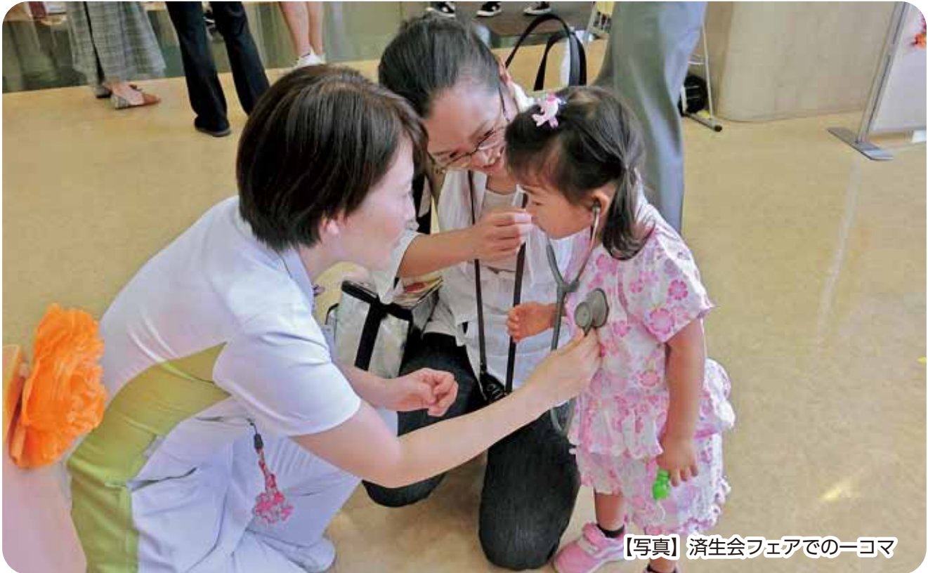
【写真】 済生会フェアでの一コマ